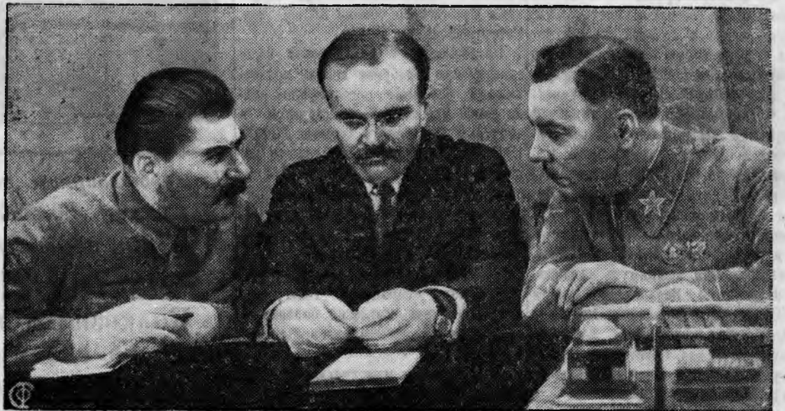
Т.т. И. В. СТАЛИН, В. М. МОЛотов и Н. Е. ВОРОШИЛОВ в президиуме совещания руководящих работников МТС и земельных органов с руководителями партии и правительства